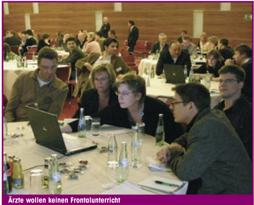
Ärzte wollen keinen Frontalunterricht