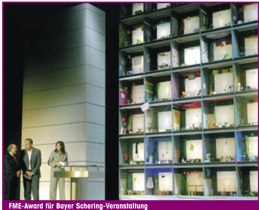
FME-Award für Bayer Schering-Veranstaltung

Da die Event-Teams auf Kundenseite viele Teilaufgaben in Eigenregie umsetzen, ist bei der Zusammenarbeit mit einer Agentur ein strukturiertes Management unerlässlich. Auch ein Projektmanagement der kleinen Schritte ist obligatorisch: Briefing, Rebriefing, eine klare Timeline mit definierten Schritten, Jour-fixes, Gewerkemeetings etc. Liepold: „Und