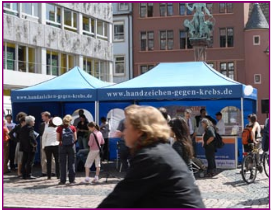
Roche-Kampagne ‚Darmkrebs auf der Spur‘

Pharmahersteller setzen verstärkt auf Veranstaltungen, die der Qualifizierung und Motivation des Vertriebs dienen, der immer mehr zum Schlüssel für den Absatz- und Umsatzerfolg wird. Beratungs- und erklärungsbedürftige Produkte verlangen nach einer starken Serviceorientierung und Beratungskompetenz im persönlichen Kontakt. Außerdem müssen die in immer kürzeren Intervallen durch verschiedene Maßnahmen seitens des Gesetzgebers betroffenen Ärzte und Apotheker verstärkt beraten und von der Wirksamkeit von Produkten überzeugt werden. Hier bieten sich für Agenturen neue Wirkungsfelder: Produkt-